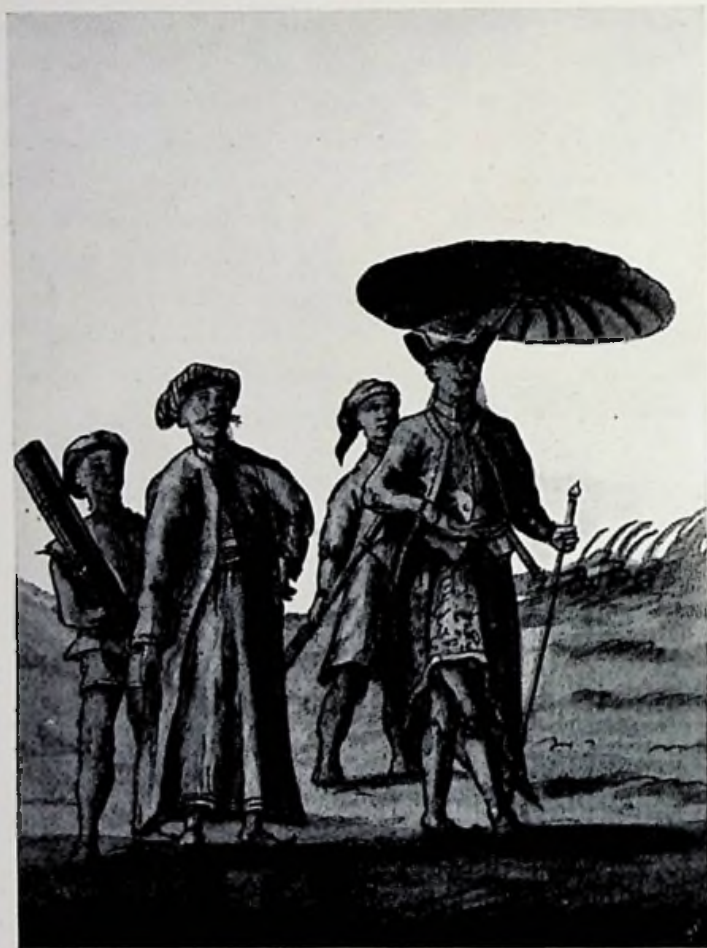
Regent van INDRAMAJOE 1770.