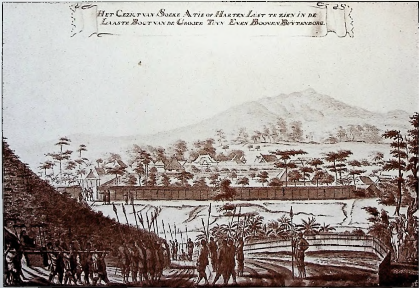
De G.-G. VAN DER PARRA bezoekt den Regent van Buitenzorg.