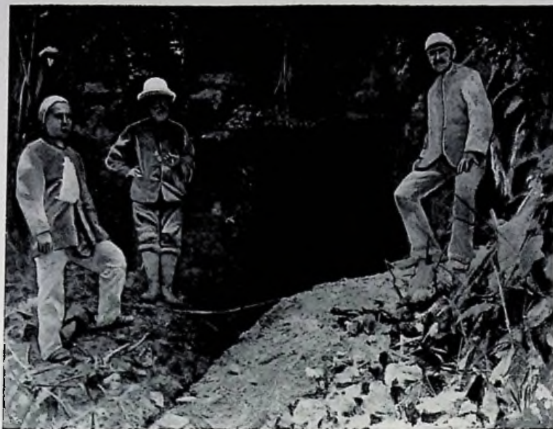
Mijningang aan den PASIR ANGIN 26 Febr. 1888.