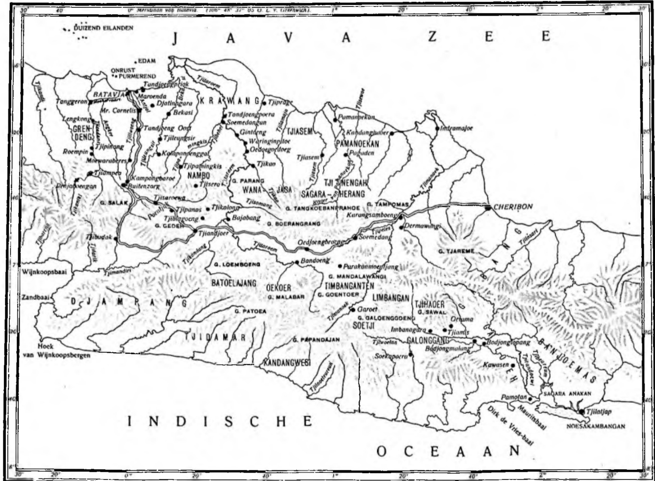
OVERZICHTSKAARTJE BIJ PRIANGAN, Eerste deel.

De op het kaartje getrekkende weg is de heidensgacht