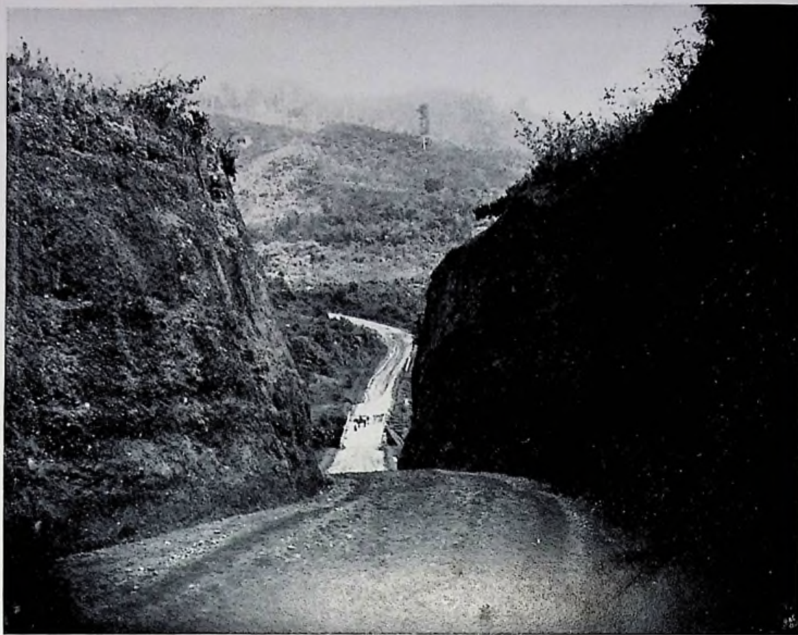
De weg van DAENDELS tusschen den Poentjak en Sindanglaja 1875.