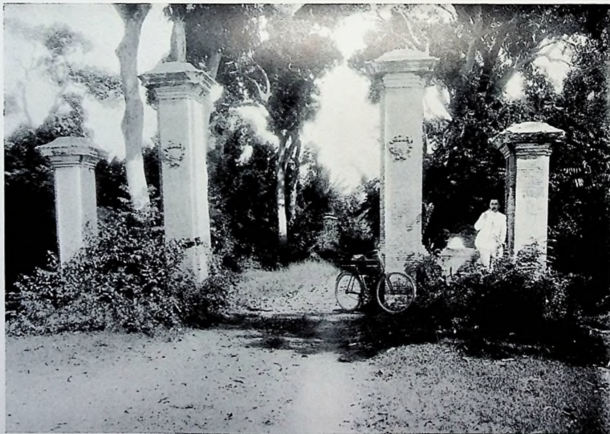
Ingang van ZWAARDECROON'S buitenplaats Leenhofs Weergade 20 December 1908.