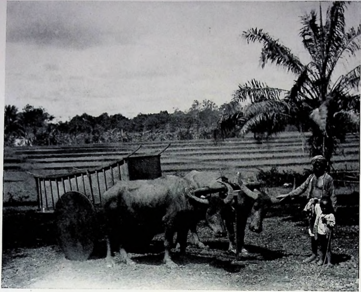
De ouderwetsche pedati.