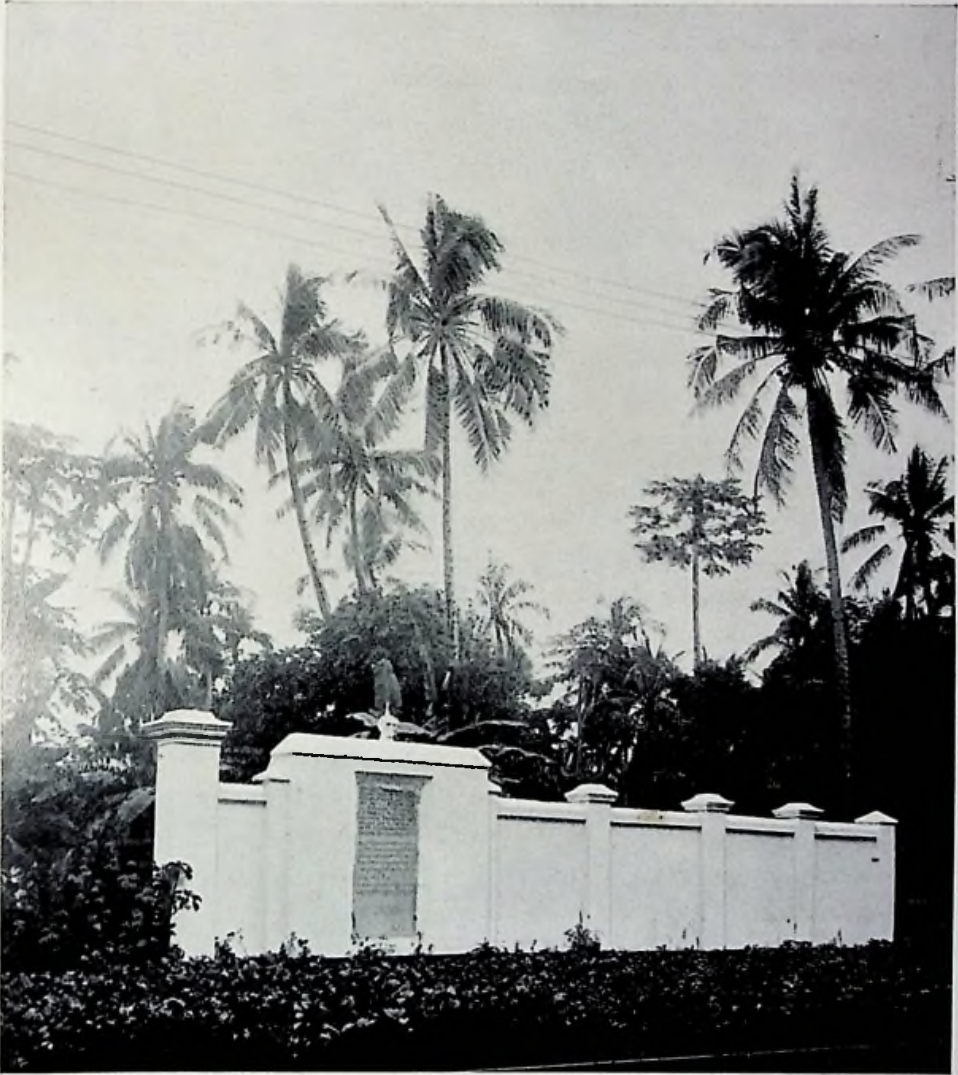
Gedenksteen van PIETER ERBERVELT.