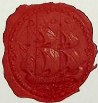
Grootzegel van G.-G. en Raden 1684.